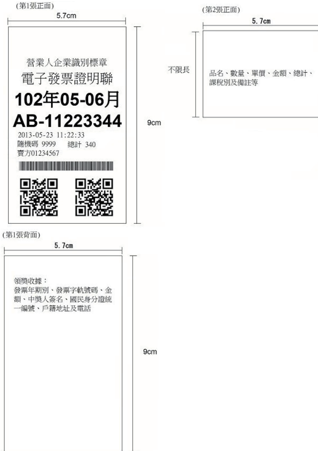
圖 1-1 買受人為非營業人之格式(範例)